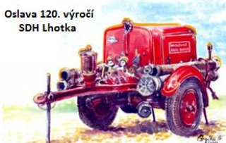
Oslava 120. výročí SDH Lhotka

Sbor dobrovolných hasičů Lhotka uspořádal dne 26. 7. 2014 na fotbalovém hřišti oslavu u příležitosti svého 120. výročí založení.