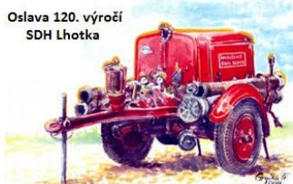
Oslava 120. výročí SDH Lhotka

Sbor dobrovolných hasičů obce Lhotka společně se zastupiteli obce Lhotka zvou občany na 120. výročí založení Sboru dobrovolných hasičů obce Lhotka, které se koná dne 26. 7. 2014 na fotbalovém hřišti.