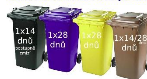
Frekvence svozu od rodinných domů

Žádost na zavedení systému door to door byla úspěšně finalizována a je připravena k podání do vyhlášené 59. výzvy Operačního programu životního prostředí – Oddělený sběr a svoz, sběrné dvory . Výzva cílí na kompostéry, RE-USE centra, vratné nádoby a obaly, sběrné dvory, door to door systémy a zavádění systému PAYT („Pay-as-You-Throw“). Jedná se o systém, díky kterému dochází k prokazatelnému snížení množství směsných komunálních odpadů vyprodukovaných na území obce. Princip spočívá v tom, že občané mají nádoby na třídění u svého domu. Třídění odpadu tak začíná přímo v domácnostech. Toto opatření má až neuvěřitelné výsledky , o desítky procent kleslo množství směsného odpadu v černých popelnicích. Zároveň se navyšuje množství vytrříděných surovin. Výhodou je, že díky systému je možné vést evidenci pro jednotlivé domácnosti, a tak mít přehled o jednotlivých tocích odpadů. Dají se tak např. snadno určit slevy na poplatku pro jednotlivé domácnosti. V kontextu toho, že výzva je průběžná, očekáváme vyhodnocení na přelomu března a dubna 2024 .